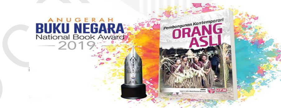
Rajah 1.1 : Buku Ilmiah Berbahasa Melayu Pembangunan Kontemporari Orang Asli

Kajian ini membataskan penelitian terhadap dua buah buku ilmiah berbahasa Melayu terbitan ahli MAPIM iaitu Pembangunan Kontemporari Orang Asli terbitan Penerbit UPM dan Demokrasi Kepimpinan & Keselamatan dalam Politik Malaysia terbitan Penerbit UKM. Pemilihan terhadap dua buah buku ini bersandarkan beberapa pertimbangan yang bersesuaian dengan objektif dan keperluan kajian. Kedua-dua buah buku ilmiah ini mempunyai keistimewaan tersendiri antaranya pernah memenangi Anugerah Buku Negara pada tahun 2019 dan mendapat sambutan yang tinggi dalam kalangan pembaca kerana telah diulang cetak sebanyak empat kali.