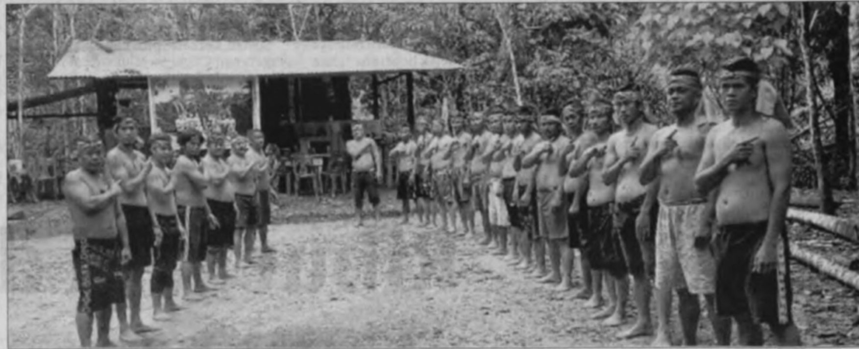
PELAJAR sekolah adat di sekolah pondok di Tongod.

Namun katanya, sekolah adat ini harus berfungsi dengan bantuan teknologi terkini untuk menyimpan