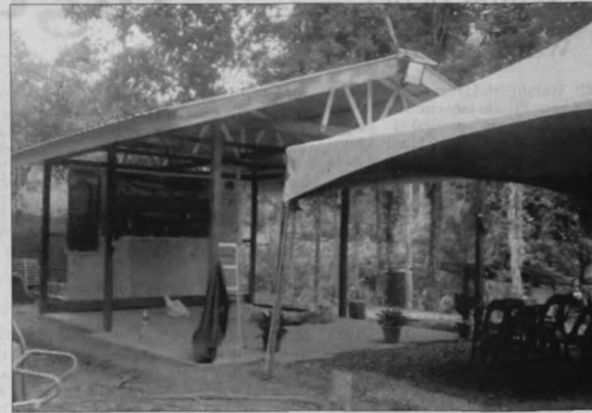
SEKOLAH adat tidak berdinging menanti dana untuk dinaik taraf.

Kata Shalmon, ketika pelancaran sekolah adat ketiga di Ulu Tolungan Telipok pada September lalu, sembilan pelajar pintar dari SMK Tun Fuad Stephen Kiulu hadir