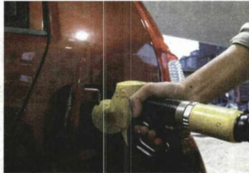
Kerajaan terpaksa menanggung kos subsidi petrol tahun ini sebanyak RM37.3 bilion.

"Idea subsidi bersasar ini masih tidak jelas sejak pentadbiran sebelum ini lagi. Kita tidak seharusnya bincang perkara ini melalui lensa 'kaya lawan miskin' dan sebaliknya. Mungkin kita perlu membincangkan lagi mekanisme yang paling sesuai untuk laksanakan perkara ini," katanya.