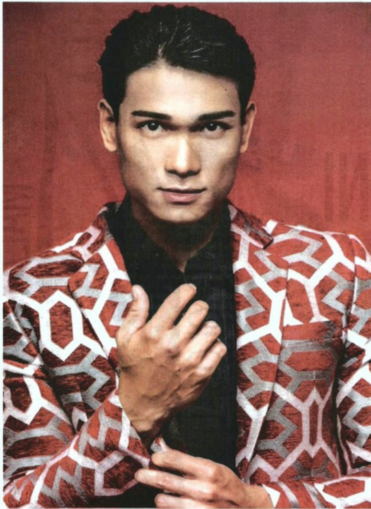
DARIPADA seorang atlet menjadi peragawan.

"Jadi saya turut mengikuti kelas berjalan catwalk dan syukur segala usaha yang dilakukan sudah menampakkan hasil. Jadi pada Februari