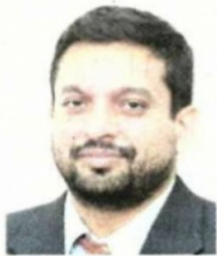
Profesor Madya di Sekolah Perniagaan dan Ekonomi, Universiti Putra Malaysia (UPM)

Perubahan iklim dan cuaca membawa khabar berita jelas untuk semua pihak bersedia berhadapan dengan bencana alam berpotensi menjejaskan ekonomi negara yang terkesan disebabkan ketidakpastian ekonomi global.