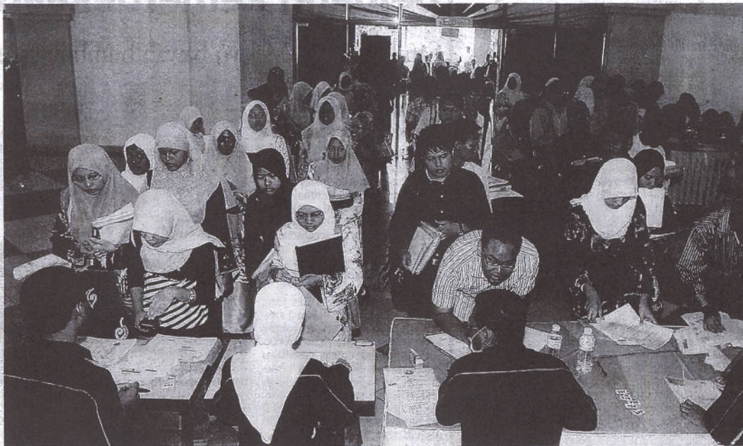
BILANGAN pelajar yang ditawarkan ke IPTA meningkat setiap tahun menyebabkan persaingan semakin sengit.