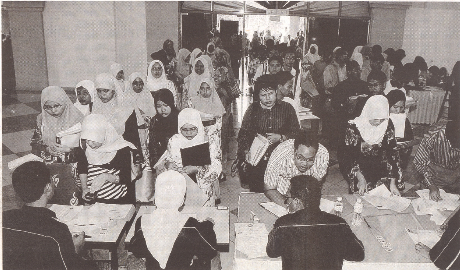
BILANGAN pelajar yang ditawarkan ke IPTA meningkat setiap tahun menyebabkan persaingan semakin sengit.