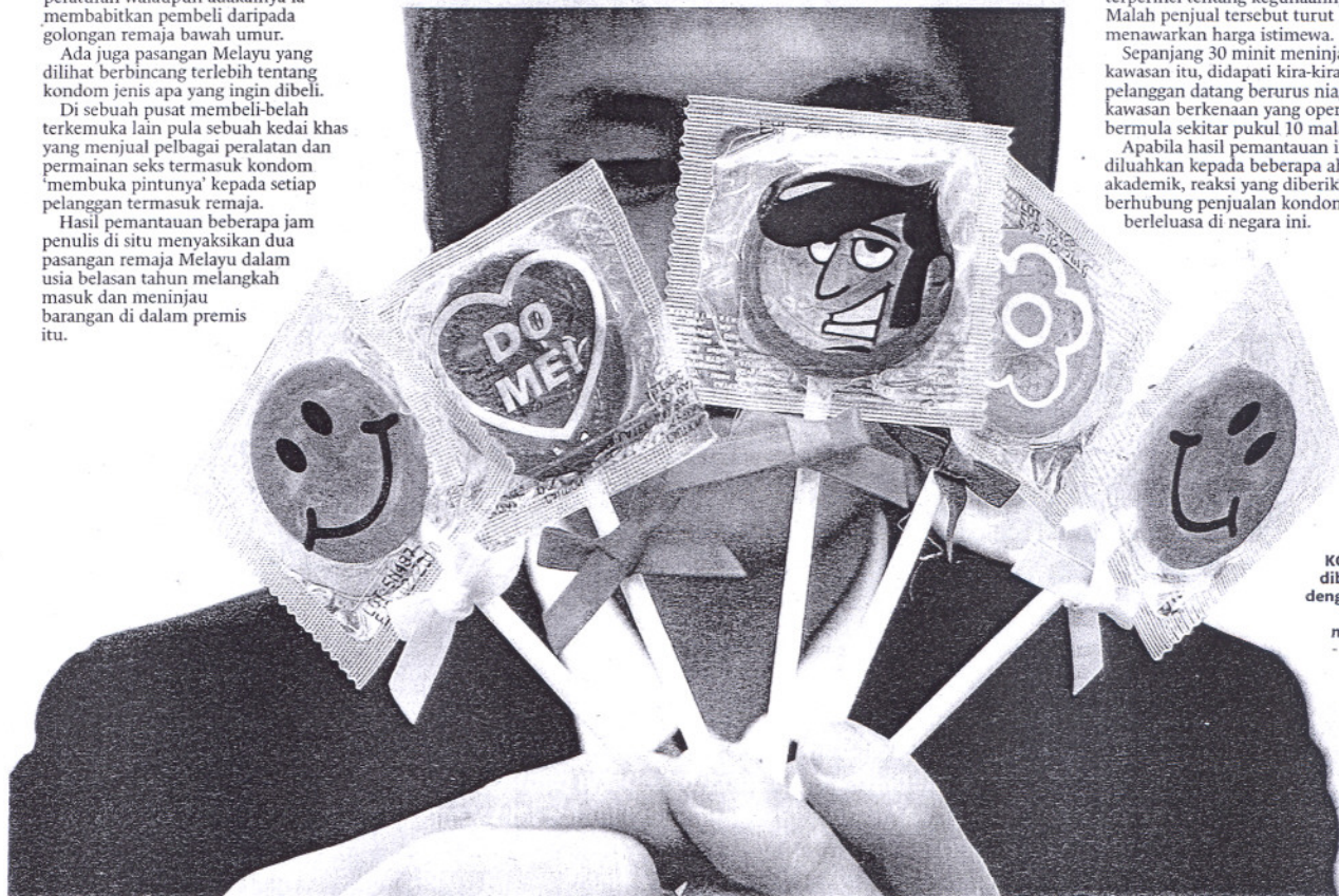
KONDOM dibungkus dengan cara yang menarik. - Gambar hiasan

Apabila hasil pemantauan ini diluahkan kepada beberapa ahli akademik, reaksi yang diberikan berbeza berhubung penjualan kondom secara berleluasa di negara ini.