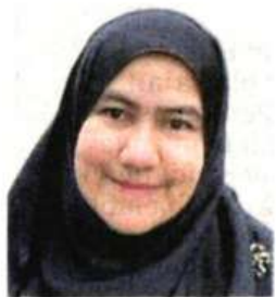
Pensyarah Institut Pengajian Sains Sosial, Universiti Putra Malaysia (UPM)