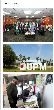
INSPEM sambut ulang tahun ke-20 penubuhan di UPM (/berita/inspem_sambut_ulang_tahun_ke_20_penubuhan_di_upm-66234)