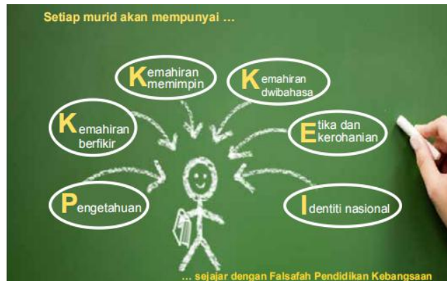
Rajah 1.4: Enam Ciri Utama yang Diperlukan oleh Setiap Murid untuk Berupaya Bersaing Pada Peringkat Global