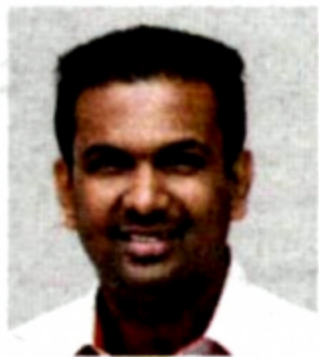
Timbalan Pengarah Pusat Strategi dan Perhubungan Korporat, Universiti Putra Malaysia (UPM)

Cukup-cukuplah segala pujuk rayu yang kita buat. Sudah tiba masanya bertindak agresif dan tegas, jika tidak kes akan semakin meningkat dan terus menjadi mimpi buruk kepada anggota masyarakat.