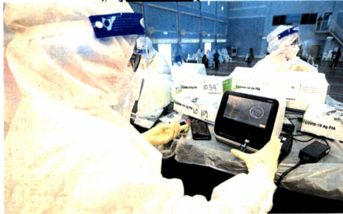
各州病例都出现明显增幅,唯独纳閩病例却不增反降。(档案照)