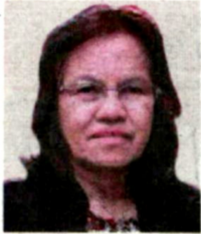
Ketua Kluster Sekuriti Makanan dan Pertanian, Akademi Profesor Malaysia (APM) dan Felo Penyelidik Universiti Putra Malaysia (UPM)