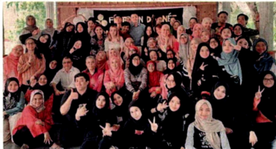
Pelajar Bachelor Sastera Pengajian Bahasa Perancis dengan Kepujian bersama barisan pensyarah sempena program Minggu Bahasa Asing anjuran Jabatan Bahasa Asing, Fakulti Bahasa Moden dan Komunikasi UPM.

"Ketrampilan berbahasa dan pemahaman budaya Perancis membuka minda seseorang untuk melihat suatu isu daripada perspektif antarabangsa, dan dengan ini ia dapat menyelesaikan masalah komunikasi inter dan intra budaya," ujarnya lagi.