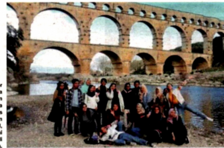
Pelajar Bachelor Sastera Pengajian Bahasa Perancis dengan Kepujian UPM, menjalani mobiliti di Perancis.

"Ini membuktikan bahasa Perancis ada nilai kepentingan yang tersendiri.