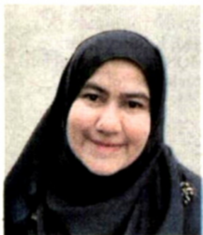
Profesor Madya di Jabatan Kesihatan Persekitaran dan Pekerjaan, Fakulti Perubatan dan Sains Kesihatan, Universiti Putra Malaysia (UPM)

Disiplin dan komitmen rakyat di semua lapisan, tidak kira kedudukan, kuasa dan taraf akan menjadi penentu sama ada kita benar-benar berjaya atau tidak dalam peperangan mencabar ini.