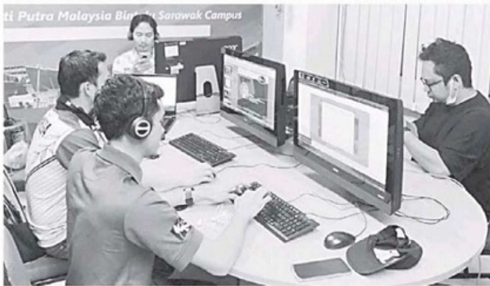
DI SEBALIK TABIR: Antara jawatankuasa pengelola yang terlibat dalam penganjuran SCeW 3.0.