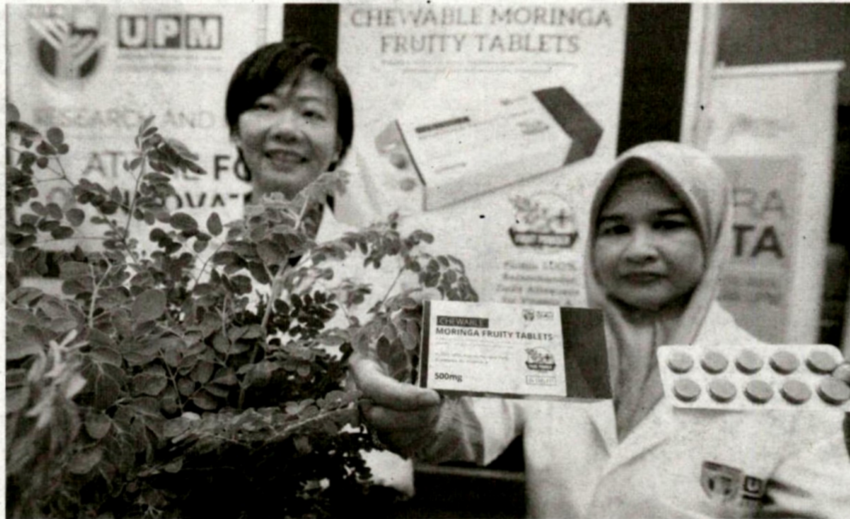
SELAIN melahirkan graduan, universiti juga berfungsi menghasilkan idea atau ciptaan baharu.

Selama berkhidmat di universiti, saya dapati masih ramai ahli akademik keliru dengan istilah ciptaan ( invention ) dan inovasi.