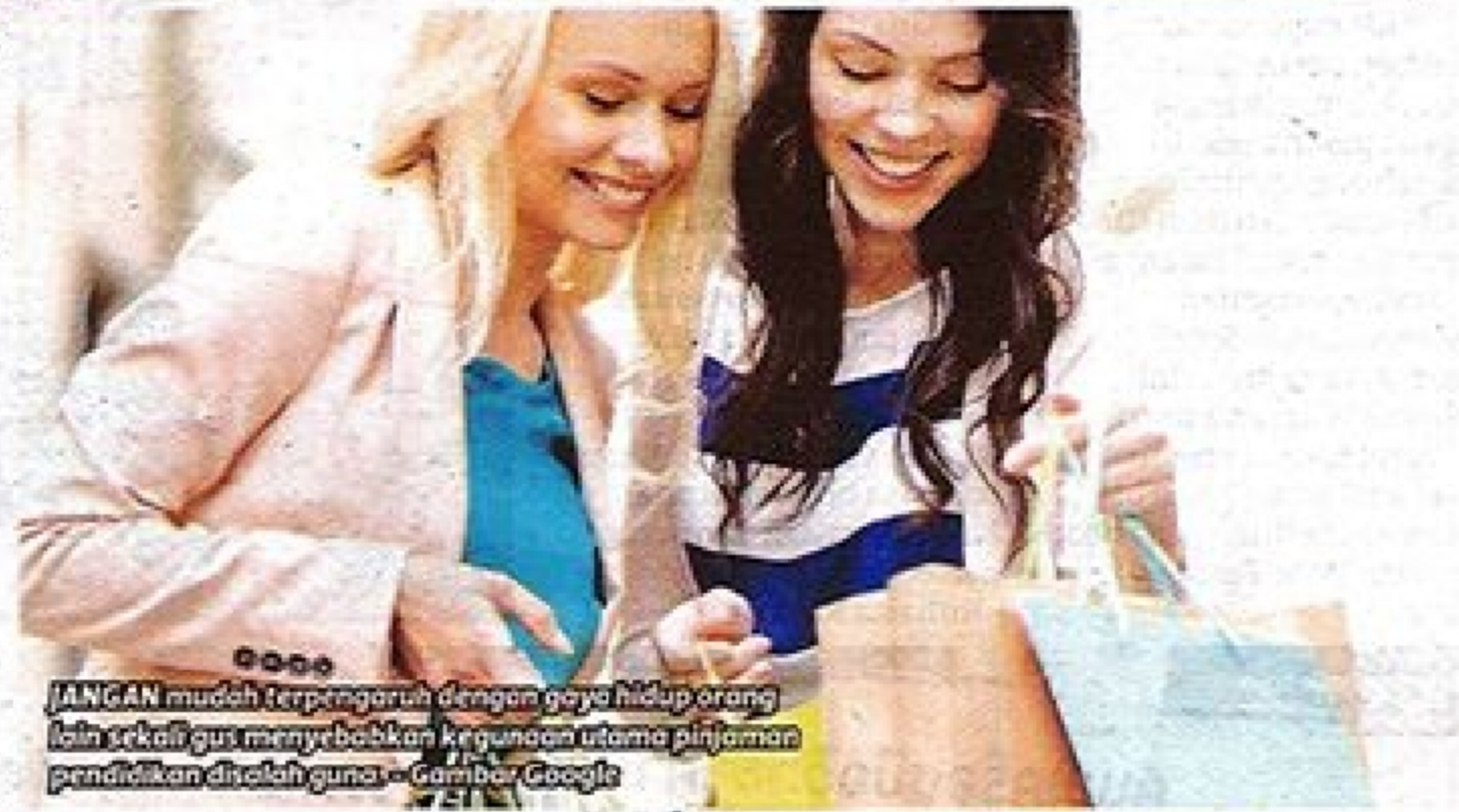
JANGAN mudah terpengaruh dengan gaya hidup orang lain sekali gus menyebabkan kegunaan utama pinjaman pendidikan diolah guna.

Antara langkah yang beliau sarankan untuk membantu siswa menjimatkan kos ialah perkongsian bersama rakan untuk memasak jika tinggal di luar asrama, mengurangkan pembelian barang tidak penting selain mengambil inisiatif melaksanakan kerja sampingan.