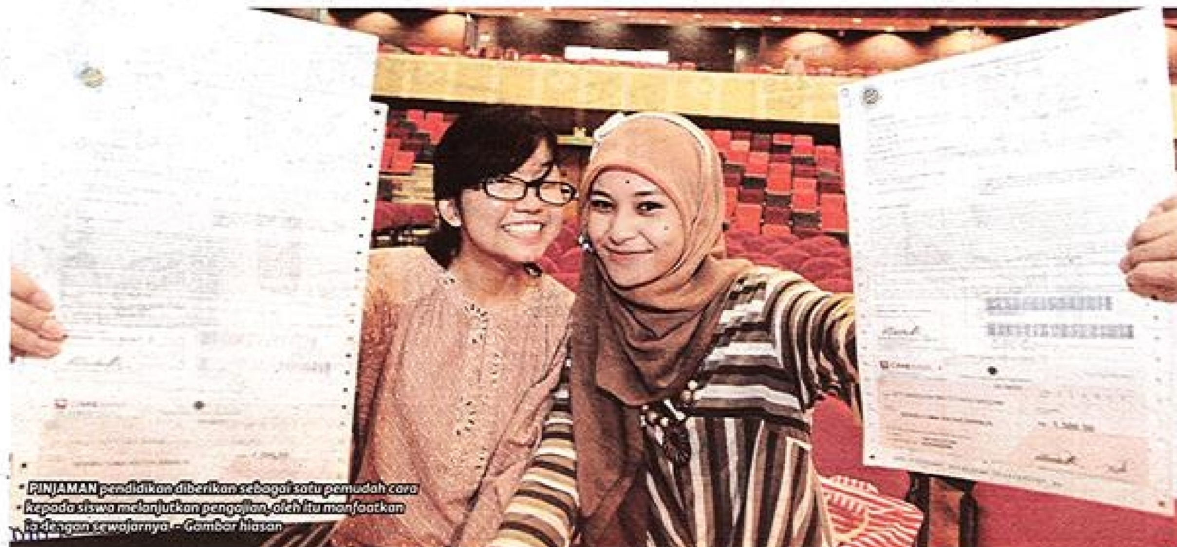
PINJAMAN pendidikan diberikan sebagai satu pemudah cara kepada siswa melanjutkan pengajian, oleh itu manfaatkan ia dengan sewajarnya. - Gambar hiasan

"Seperti mencari kerja pada hujung minggu atau cuti semesier dan duit diperoleh itu boleh menampung atau