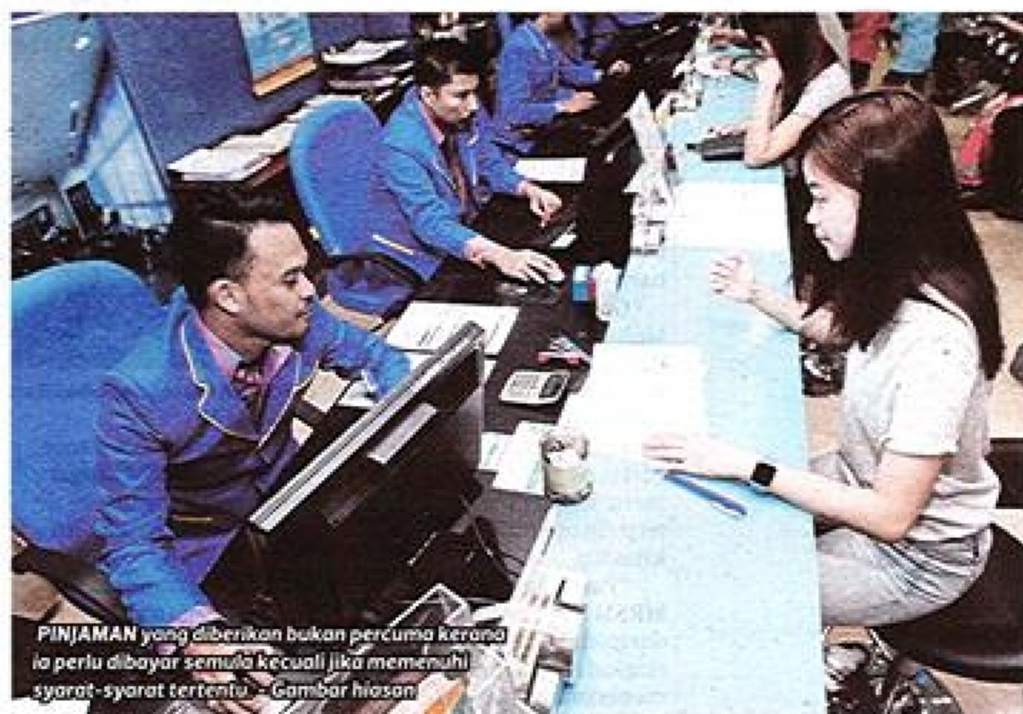
PINJAMAN yang diberikan bukan percuma kerana ia perlu dibayar semula kecuali jika memenuhi syarat-syarat tertentu. - Gambar hiasan

"Mereka tidak berfikir panjang, berbelanja mengikut kehendak melampau kerana