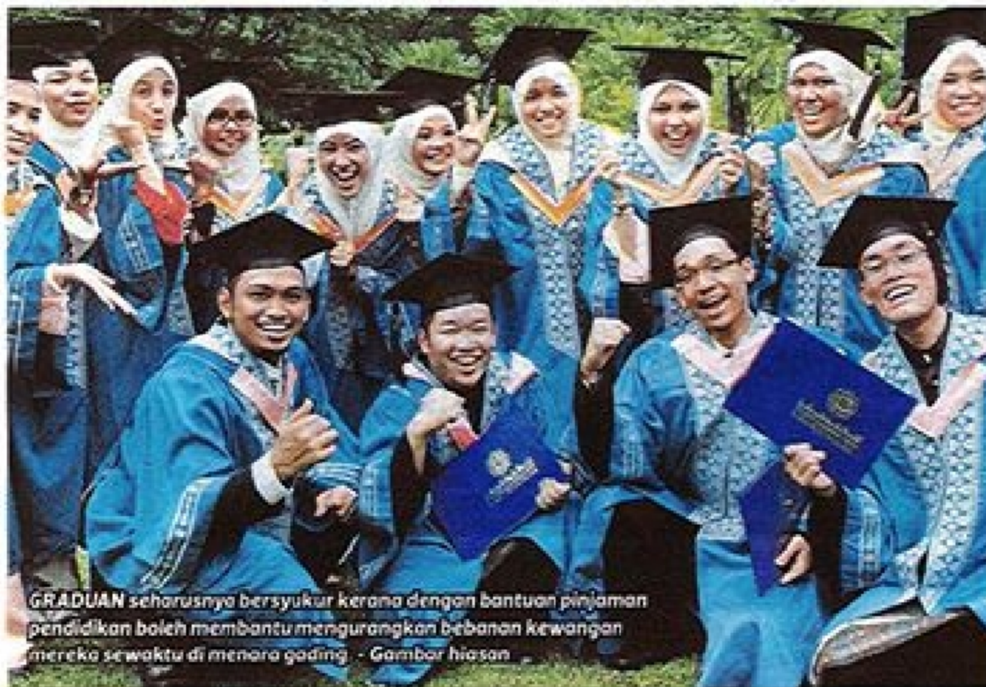
GRADUAN seharusnya bersyukur kerana dengan bantuan pinjaman pendidikan boleh membantu mengurangkan bebanan kewangan mereka sewaktu di menara gading. - Gambar hiasan