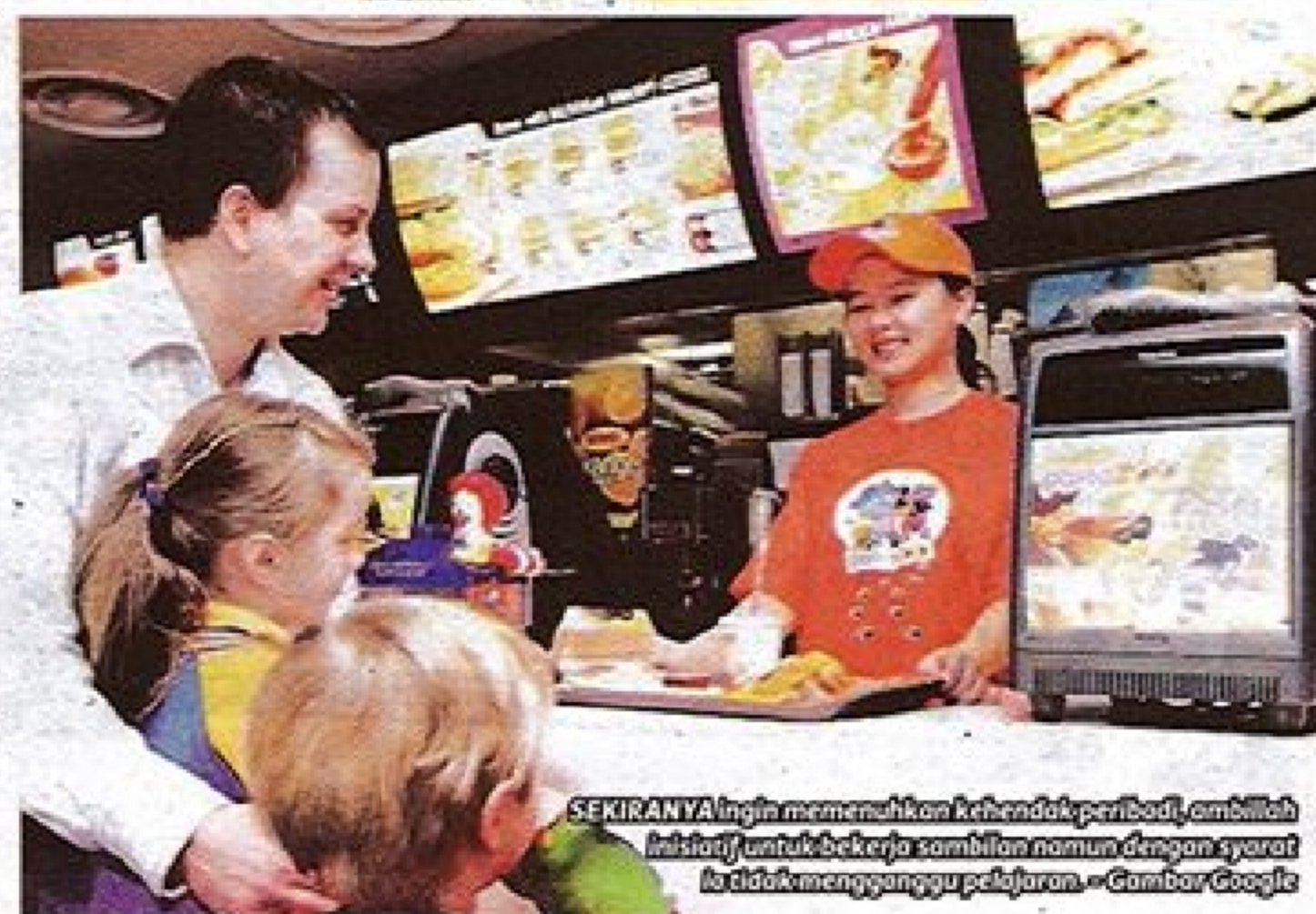
SEKIRANYA ingin memenuhi kehendak peribadi, ambillah inisiatif untuk bekerja sambilan namun dengan syarat ia tidak mengganggu pelajaran.