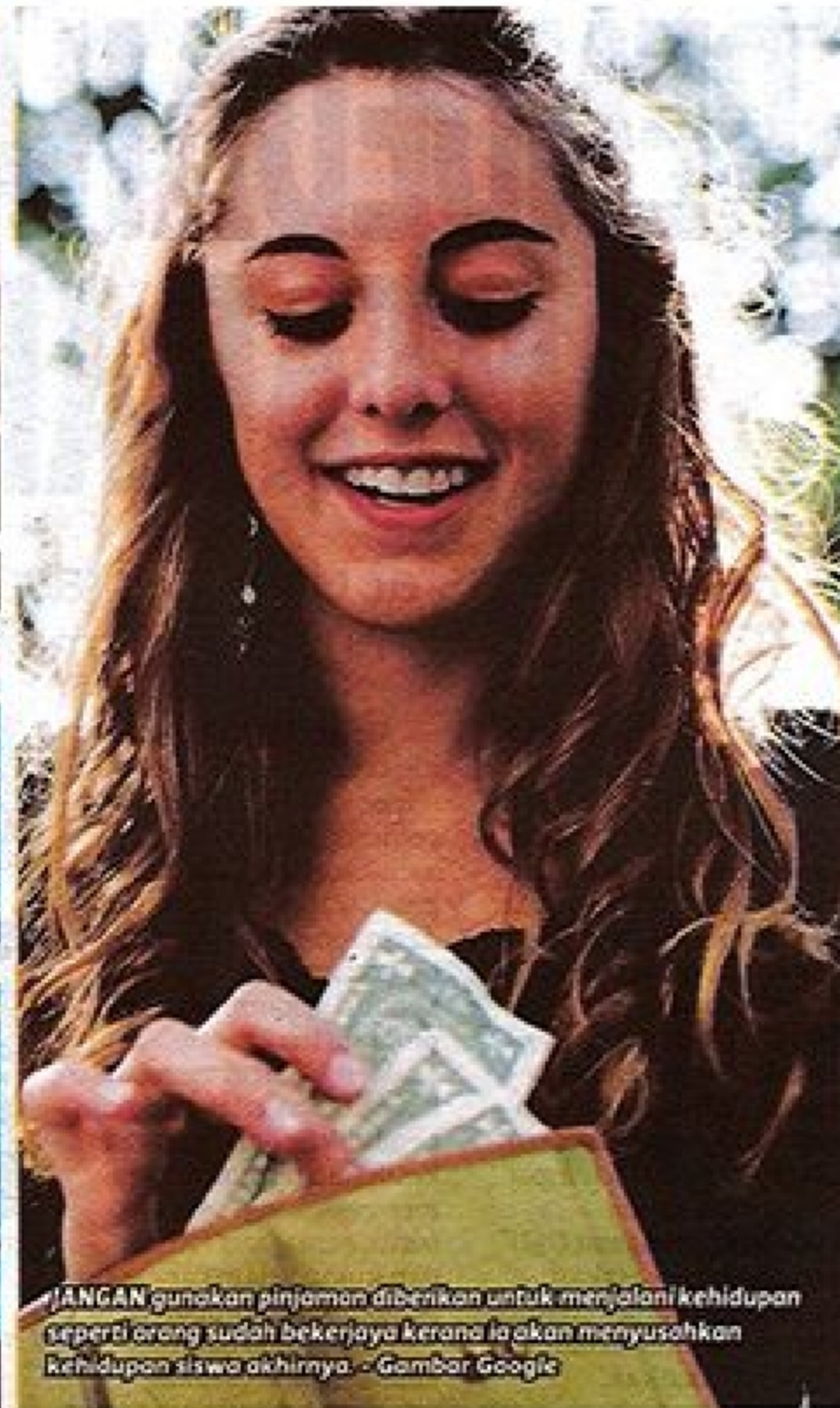
JANGAN gunakan pinjaman diberikan untuk menjalani kehidupan seperti orang sudah bekerja kerana ia akan menyusahkan kehidupan siswa akhirnya.