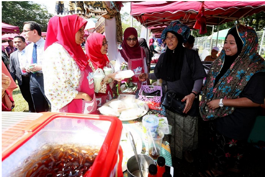
Orang ramai mengunjungi gerai yang mengambil bahagian di Pesta Makanan Tradisional Melayu 2019 di Universiti Putra Malaysia, Serdang.

Prof Zulkifli juga berkata, beliau teruja melihat sambutan menggalakkan daripada pengusaha dan pengunjung sekali gus membuktikan sokongan terhadap makanan tradisional sentiasa ada.