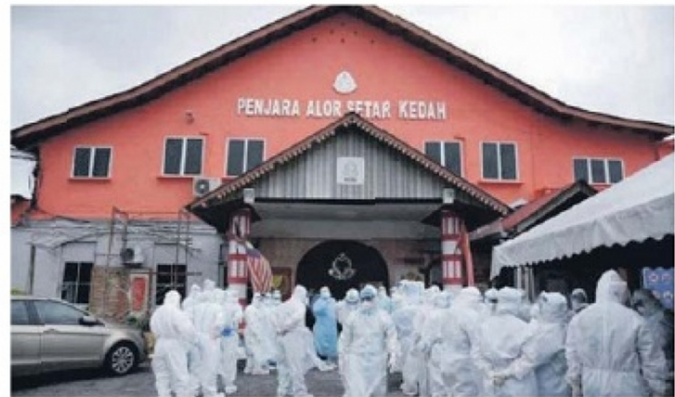
Kluster Tembok di Penjara Alor Setar mencatatkan penularan kes Covid-19 tertinggi dalam tempoh dua minggu apabila sejumlah 1,207 kes positif direkodkan.