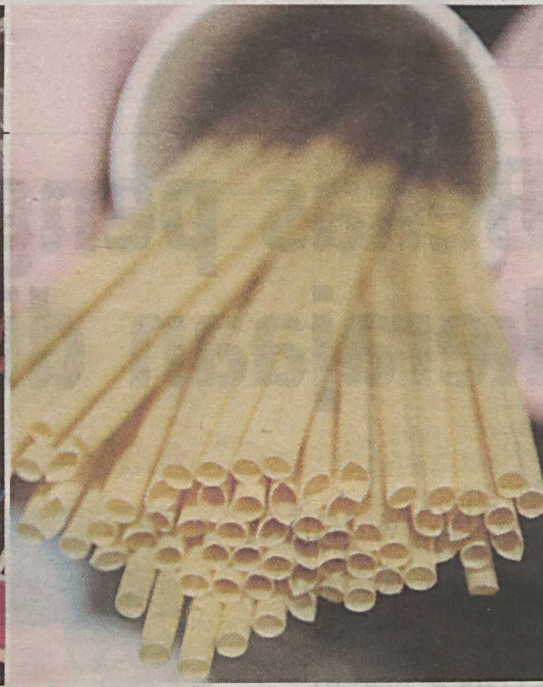
Pengusaha restoran mengambil inisiatif meletakkan gegantung dan pelekat 'Kempen Tiada Penyedut Minuman' di sekeliling premis ketika tinjauan di sekitar Bangsar, semalam.