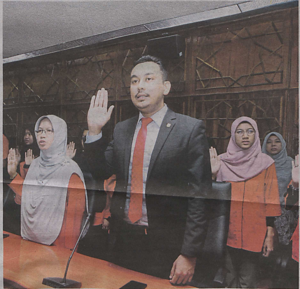
Kakitangan universiti turut mengambil bahagian dalam majlis ikrar bebas rasuah dan integriti. (Foto hiasan)

"UA di negara ini sentiasa mengadakan jerayawara, taklimat serta bengkel yang berkaitan dari semasa ke semasa bagi mengelakkan berlakunya perbuatan tidak beretika dalam penyelidikan dan penerbitan akademik," katanya.