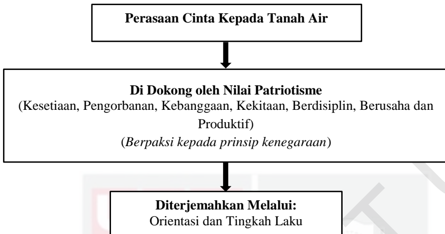
Rajah 1.3: Konsep Patriotisme

Konsep patriotisme berdasarkan rumusan pengkaji: