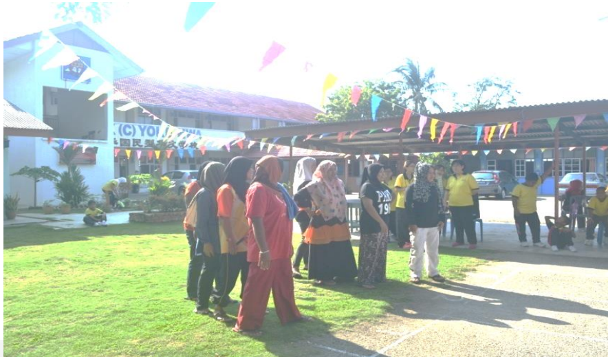
Gambar 1.2: Suasana semasa merentas desa dan Hari Sukan