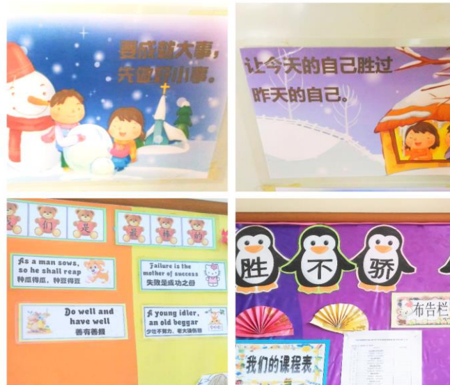
Gambar 1.3: Pepatah yang terdapat dalam sekolah

Bukan itu sahaja, bahasa penghantaran yang digunakan adalah 100% dalam Bahasa Cina. Walaupun murid yang belajar di SJKCYH adalah murid Melayu, tetapi bahasa penghantaran tetap Bahasa Cina.