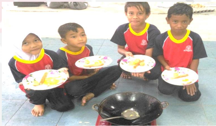
Gambar 1.1: Suasana semasa Hari Kokurikulum

khemah, belajar memasak dan membuat ikatan pengakap. Murid-murid membawa bahan dan alatan memasak dari rumah. Bahan seperti hotdog, nasi masak, minyak masak dan gas masak disediakan oleh pihak sekolah. Semasa memasak, terdapat beberapa orang murid yang kelihatan kelam kabut, tetapi selepas diberi tunjuk ajar oleh ahli kumpulannya, mereka pun dapat menggoreng telur dan hotdog. Bukan itu sahaja, apabila menggoreng nasi, setiap kumpulan kelihatan bekerjasama dalam melakukan kerja. Contohnya, ada yang menyediakan bahan, memanaskan periuk, memasak, letak bahan perasa dan sebagainya. Terdapat kumpulan yang lebih kreatif berbanding dengan kumpulan lain. Contohnya, mereka akan membuat hiasan pada nasi goreng tersebut seperti membuat muka senyum dengan menggunakan sos cili. Rujuk gambar 1.1 bagi aktiviti Hari Kokurikulum.