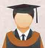
COKLAT KEEMASAN (Golden Brown) Fakulti Ekologi Manusia