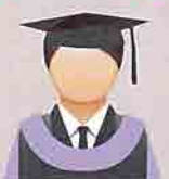
UNGU KUNDANG (Light Purple/Lavender) Fakulti Perubatan dan Sains Kesihatan