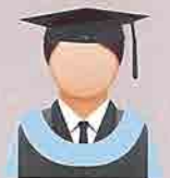
BIRU AIR LAUT (Sea Blue) Fakulti Pengajian Pendidikan