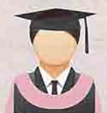
MERAH JAMBU (Pink) Fakulti Bahasa Moden dan Komunikasi