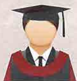
COKLAT MAHOGANI (Mahogany Brown) Fakulti Perhutanan