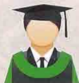
HIJAU DAUN (Leaf Green) Fakulti Pertanian

Warna hood graduan melambangkan Fakulti dan Sekolah Pengajian graduan berkenaan. Pada masa ini terdapat 19 warna iaitu :