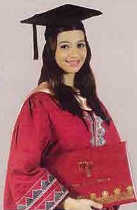
Jubah Graduan Ijazah Master warna merah maroon dengan dua (2) baris sulaman di lengan;