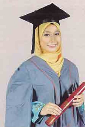
Jubah Graduan Diploma warna kelabu tanpa sulaman

(jubah graduan Diploma Pendidikan seperti jubah graduan Ijazah Bacelor tetapi dibezakan dengan hood (biru-putih))