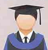
BIRU NILA (Indigo Blue) Sekolah Pengajian Siswazah Pengurusan