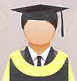
KUNING GADING (Ivory Yellow) Fakulti Ekonomi dan Pengurusan