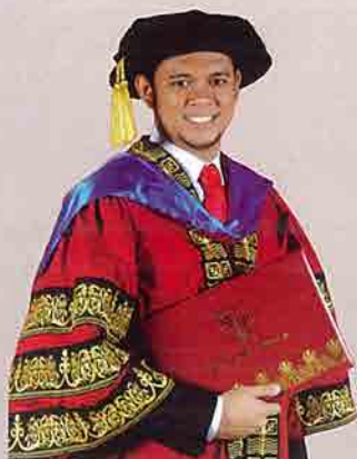
Jubah Graduan Ijazah Doktor Falsafah warna merah maroon dengan tiga (3) baris sulaman emas di lengan;

Pemakaian jubah oleh graduan ditentukan mengikut warna dan bentuk sulaman seperti berikut: