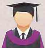
UNGU (Purple) Fakulti Perubatan Veterinar