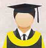
KUNING EMAS (Gold Yellow) Fakulti Sains dan Teknologi Makanan