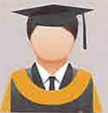
KUNING KUNYIT (Chrome Yellow) Fakulti Sains