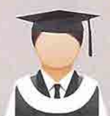
PUTIH (White) belang Biru Air Laut (Sea Blue) Diploma Pendidikan Fakulti Pengajian Pendidikan