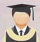
KUNING AIR (Beige) Fakulti Sains Pertanian dan Makanan UPMKB