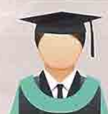
BIRU FIRUS (Turquoise Blue) Fakulti Pengajian Alam Sekitar