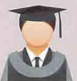
KELABU (Grey) Fakulti Sains Komputer dan Teknologi Maklumat