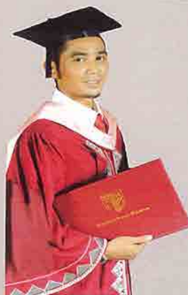
Jubah Graduan Ijazah Bacelor warna merah maroon dengan satu (1) baris sulaman di lengan