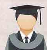
PLATINUM (Platinum) Fakulti Bioteknologi dan Sains Biomolekul