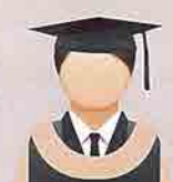
KUNING KEMERAHAN (Peach) Sekolah Pengajian Siswazah