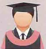
JINGGA (Bright Orange) Fakulti Kejuruteraan