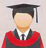
MERAH API (Flame Red) Fakulti Rekabentuk dan Senibina