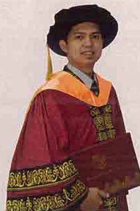
Jubah Graduan Ijazah Master Perubatan warna merah maroon dengan dua (2) baris sulaman emas di lengan;