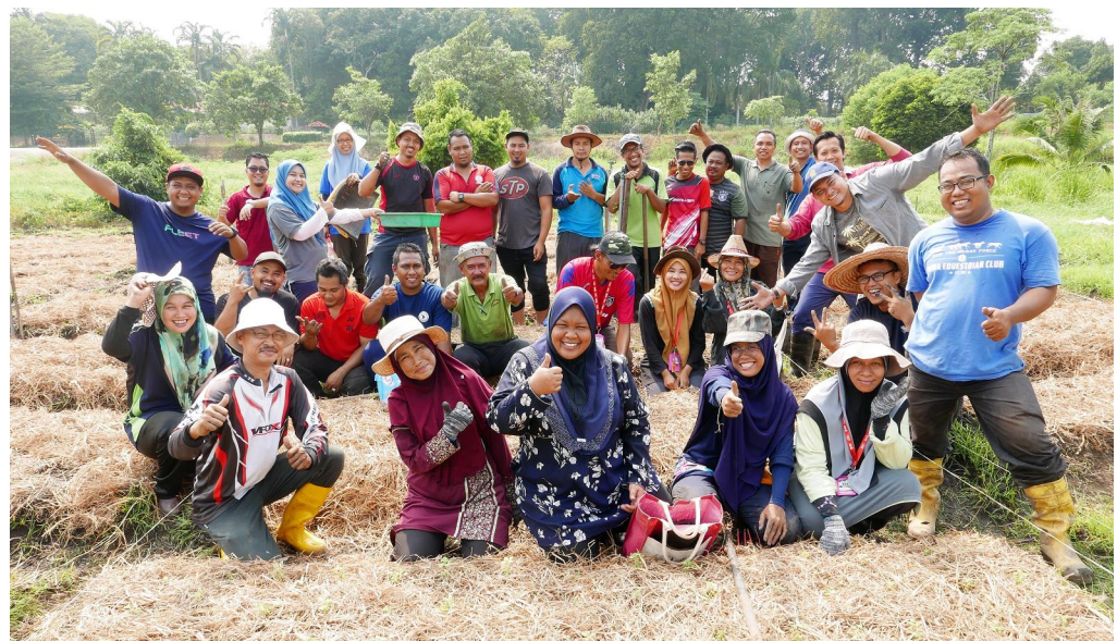
Oleh: Nafisah Awang

SERDANG, 30 Ogos – Pusat Transformasi Komuniti Universiti (UCTC), Universiti Putra Malaysia (UPM) membantu meningkatkan kemahiran vokasional tenaga pengajar Agensi Anti Dadah Kebangsaan (AADK) melalui kursus pembangunan kemahiran.