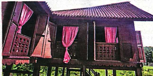
RUMAH tradisional Negeri Sembilan dimiliki pembesar istana.

Rumah tradisional ini terbahagi kepada dua bahagian, ruang ibu