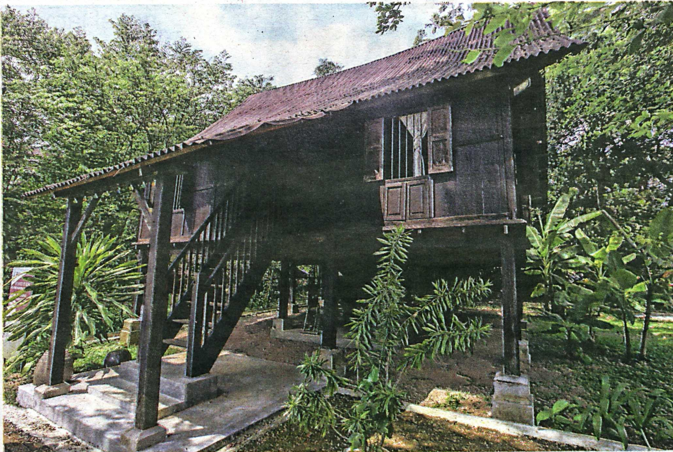
RUMAH tradisional Perak yang memiliki ciri keselamatan tersendiri.

"Bagi mewujudkan suasana kampung, kami mengekalkan kehijauan