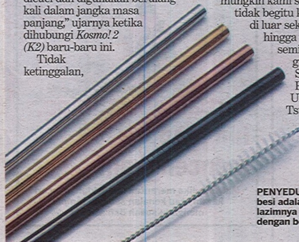
PENYEDUT minuman besi adalah selamat dan lazimnya disertakan dengan berus pencuci.