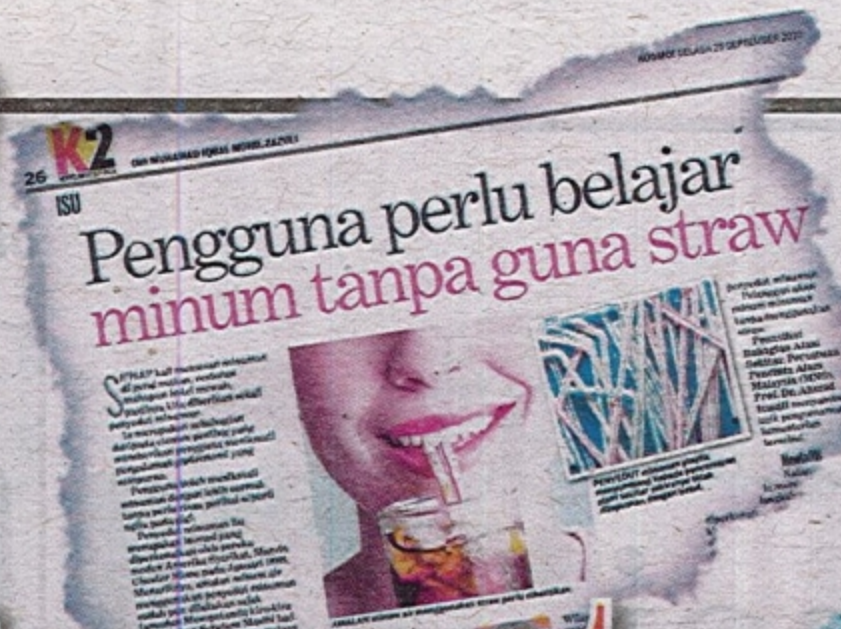
K2 pada 25 September 2018 turut melaporkan pengguna perlu belajar minum tanpa straw plastik.