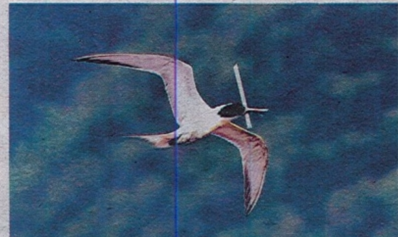
SEEKOR burung dilihat terbang sambil membawa straw plastik pada mulutnya.