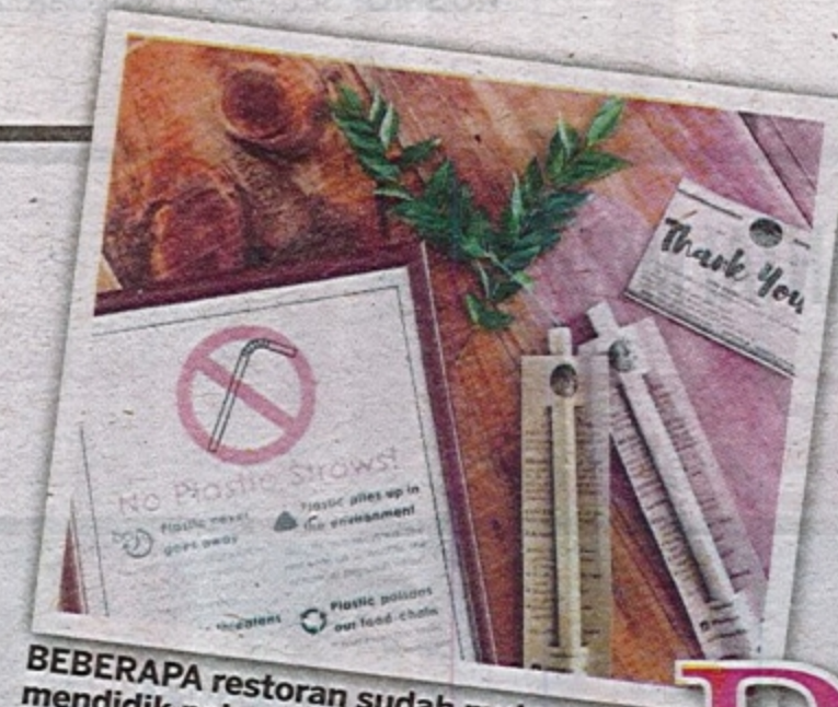
BEBERAPA restoran sudah mendidik pelanggan mengenai larangan penggunaan straw minuman plastik.