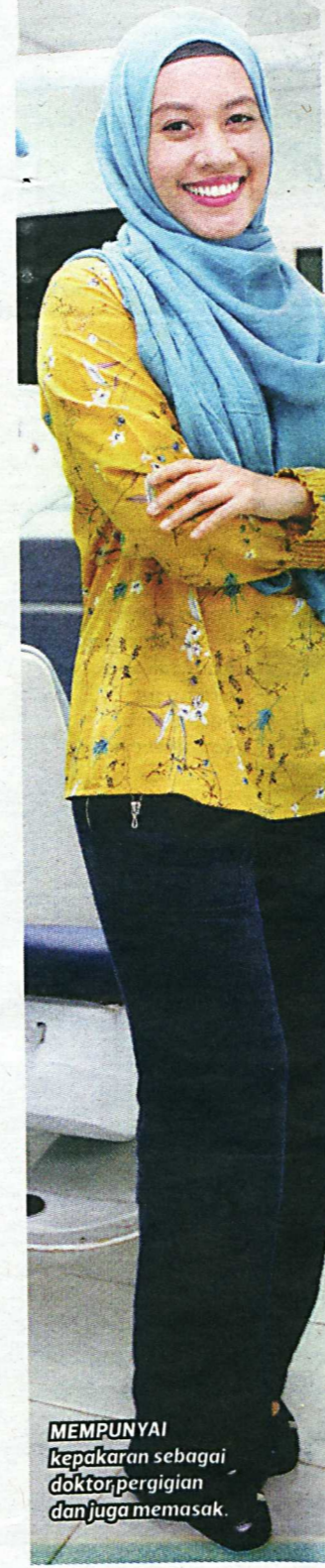
MEMPUNYAI kepakaran sebagai doktor pergigian dan juga memasak.