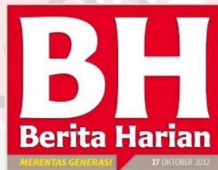
Rajah 1.3: Masthead Berita Harian

Di Malaysia, terdapat pelbagai jenis akhbar berbahasa Melayu yang telah diterbitkan seperti Berita Harian , Harian Metro , Utusan Malaysia , Kosmo! dan juga Sinar . Namun begitu, dalam kajian ini, pengkaji hanya memfokuskan kepada dua jenis akhbar sahaja, iaitu Berita Harian (BH) dan Utusan Malaysia (UM). Kedua-dua akhbar yang dipilih merupakan akhbar arus perdana yang mendapat permintaan yang tinggi dari masyarakat, malah akhbar ini juga diterbitkan oleh dua agensi yang berbeza (Audit Bureau of Circulation Malaysia, 2017). Hal ini secara tidak langsung membolehkan pengkaji untuk membuat perbandingan terhadap gaya penerbitan ( house style ) bagi kedua-dua akhbar, khususnya dari segi penggunaan bahasanya.