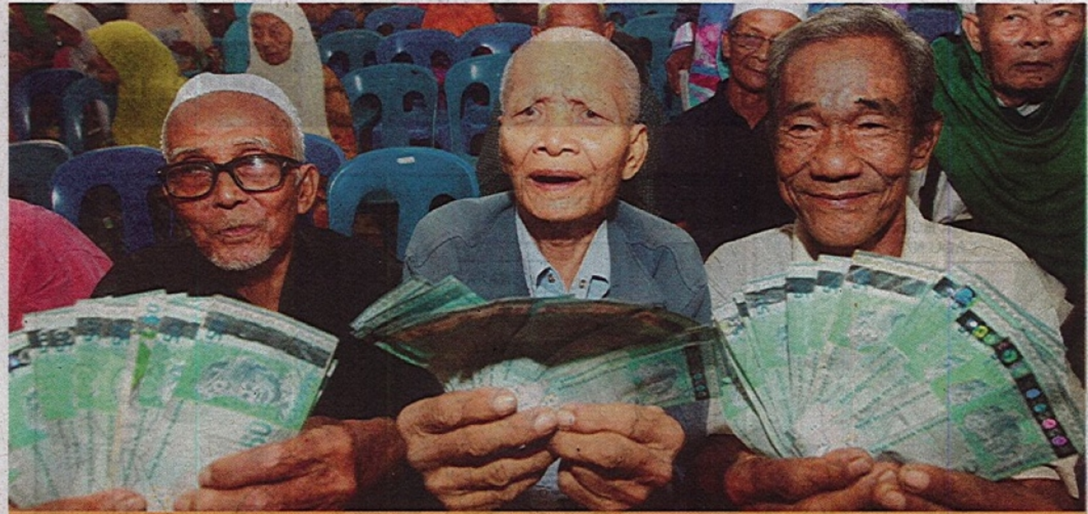
BUDAYA mengagihkan wang tunai perlu dihentikan dan digantikan dengan kaedah lain demi untuk kelangsungan kehidupan rakyat yang memerlukan.

Dan apa yang pasti segala usaha dan inisiatif yang sedang dirangka ini akan memakan masa