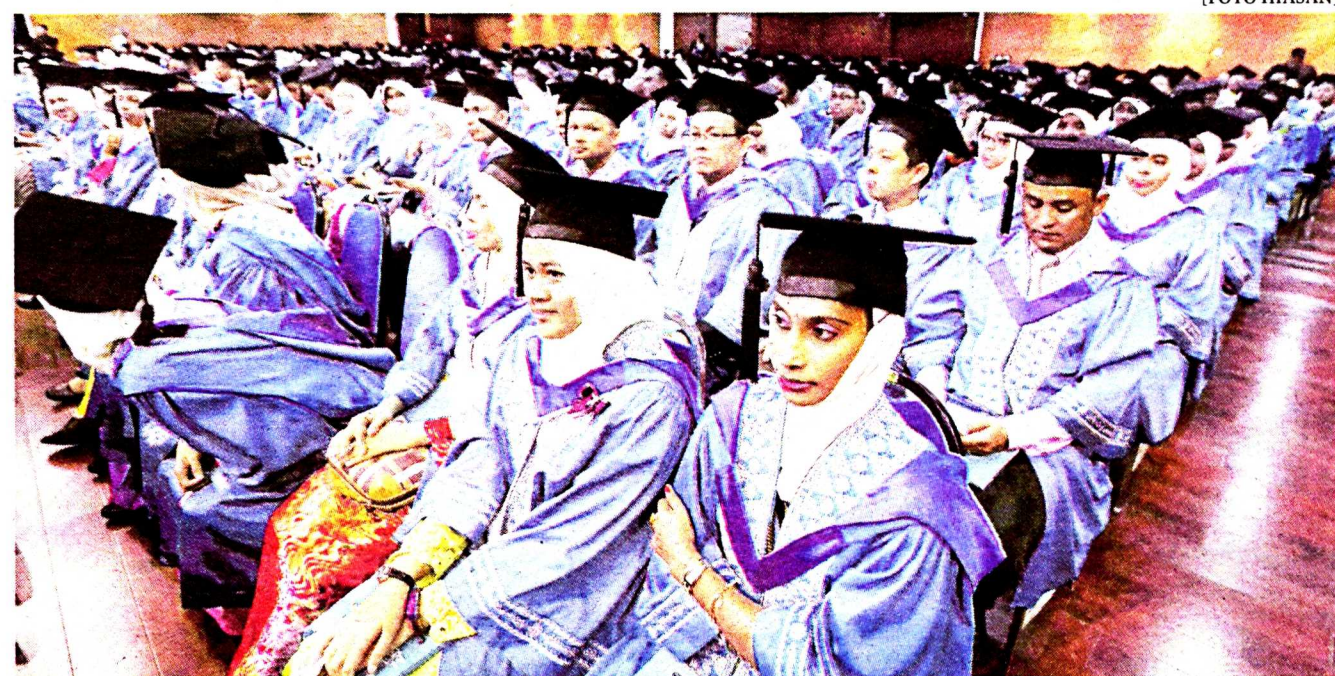
Pendidikan percuma mampu memberi peluang kepada lebih ramai individu, terutama golongan kurang mampu melanjutkan pengajian ke universiti.