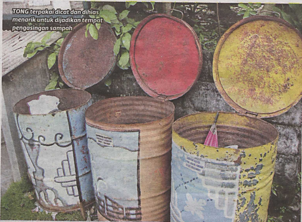
TONG terpakai dicat dan dihias menarik untuk dijadikan tempat pengasingan sampah.