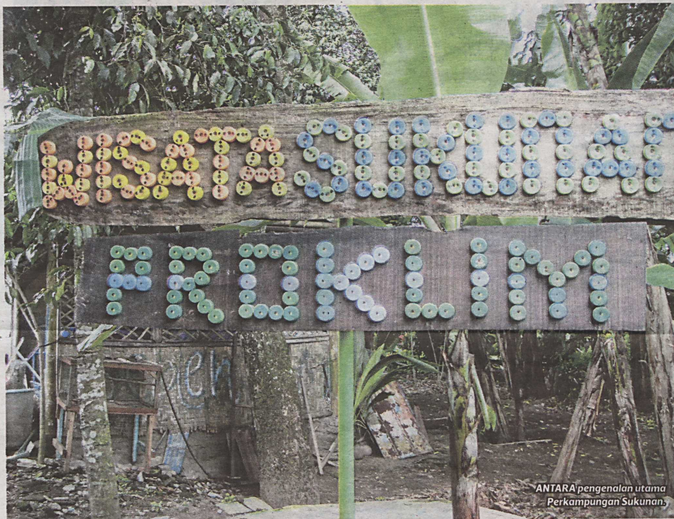
ANTARA pengenalan utama Perkampungan Sukunan.