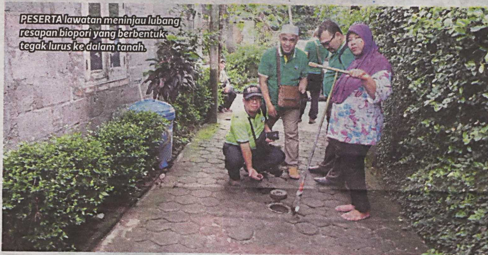
PESERTA lawatan meninjau lubang resapan biopori yang berbentuk tegak lurus ke dalam tanah.