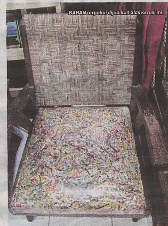
BAHAN terpakai dijadikan alas kerusi ini.

Memandangkan negara itu juga cenderung dalam pelaksanaan program yang mengambil berat pemeliharaan dan pengurusan alam sekitar dalam kalangan penduduk setempat.