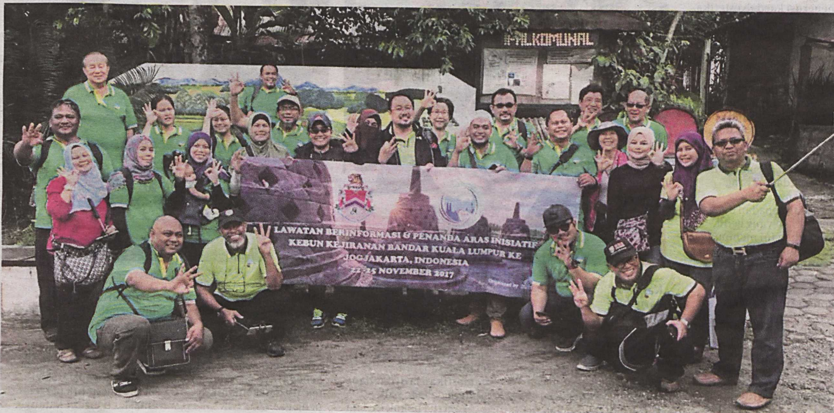
GAMBAR kenangan dirakam ketika berada di Perkampungan Sukunan.