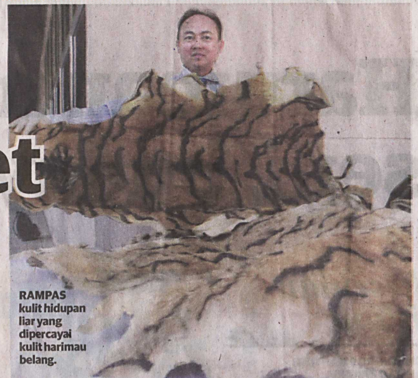
RAMPAS kulit hidupan liar yang dipercayai kulit harimau belang.