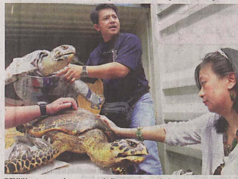
PENYU antara spesies yang menjadi mangsa penyeludup.

Dengan pengetahuan dan kesedaran orang ramai tentang pemuliharaan hidupan liar dan Malaysia sebagai negara megabiodiversiti dunia, perdagangan hidupan liar dapat dipatahkan.