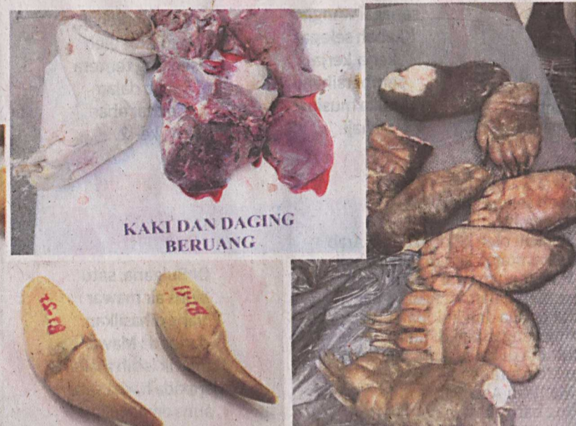
KAKI DAN DAGING BERUANG

Perhilitan boleh mengambil tindakan undang-undang melalui akta tersebut dengan menggantungkan atau membatalkan lesen perniagaan atau lesen menyimpan hidupan liar terhadap mana-mana individu atau syarikat yang terlibat dalam penjualan hidupan liar dalam talian.