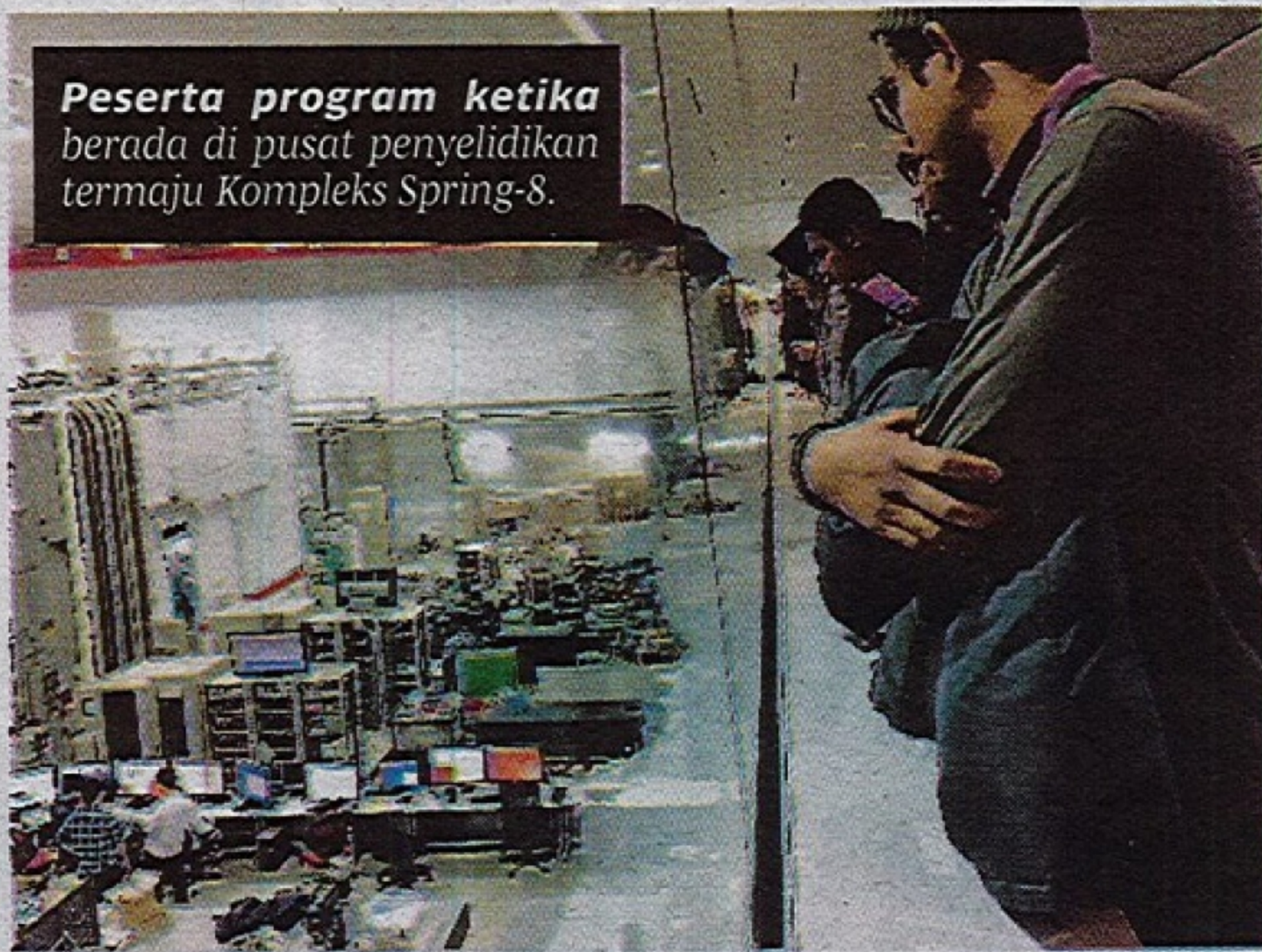
Peserta program ketika berada di pusat penyelidikan termaju Kompleks Spring-8.

"Pada penghujung program ini, peserta diminta membentangkan semua hasil dapatan yang diperoleh sepanjang mereka berada di Jepun dan membentangkan pelan perancangan masing-masing," katanya.