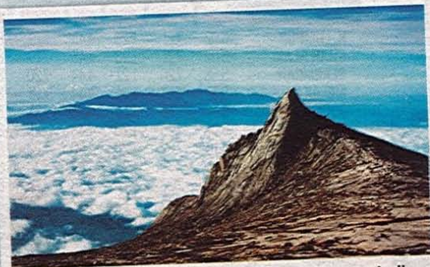
GUNUNG Kinabalu setinggi 4,095 meter menjadi lokasi popular untuk pendaki dari dalam dan luar negara.

ANGGOTA penyelamat membawa turun mangsa yang ditemui pengsan kira-kira 600 meter dari puncak Gunung Kinabalu, Kundasang kelmarin.