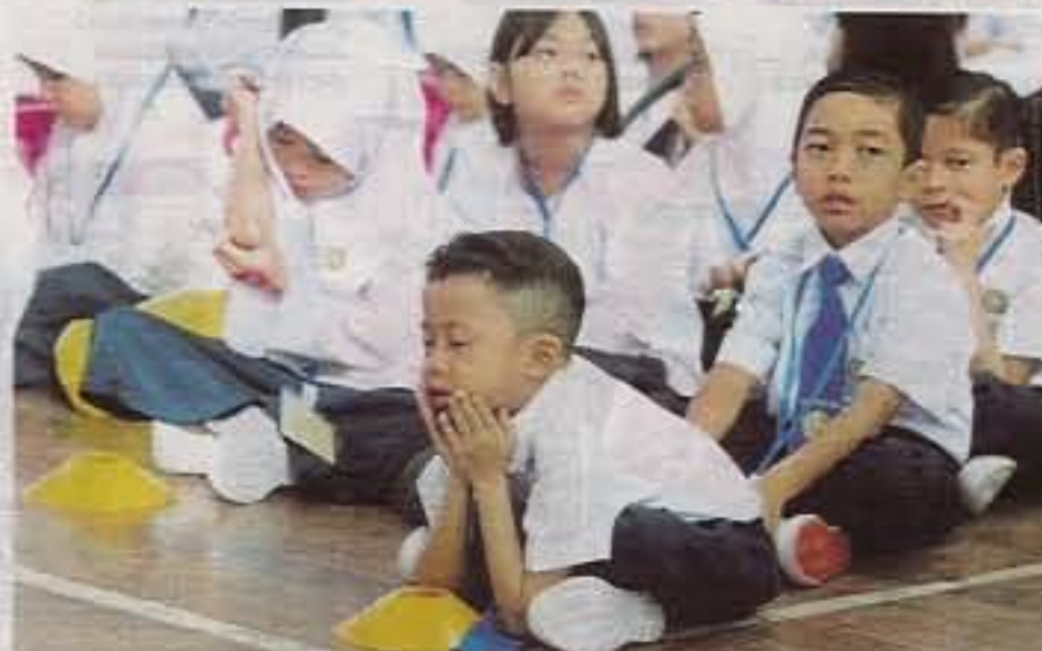
ANTARA gelagat yang mencuri tumpuan pada minggu orientasi.