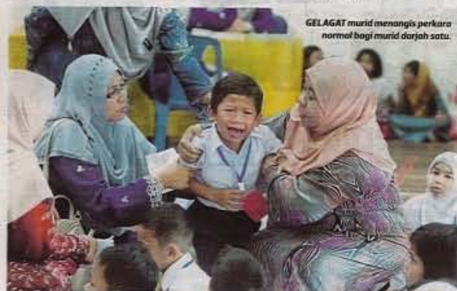
GELAGAT murid menangis perkara normal bagi murid darjah satu.