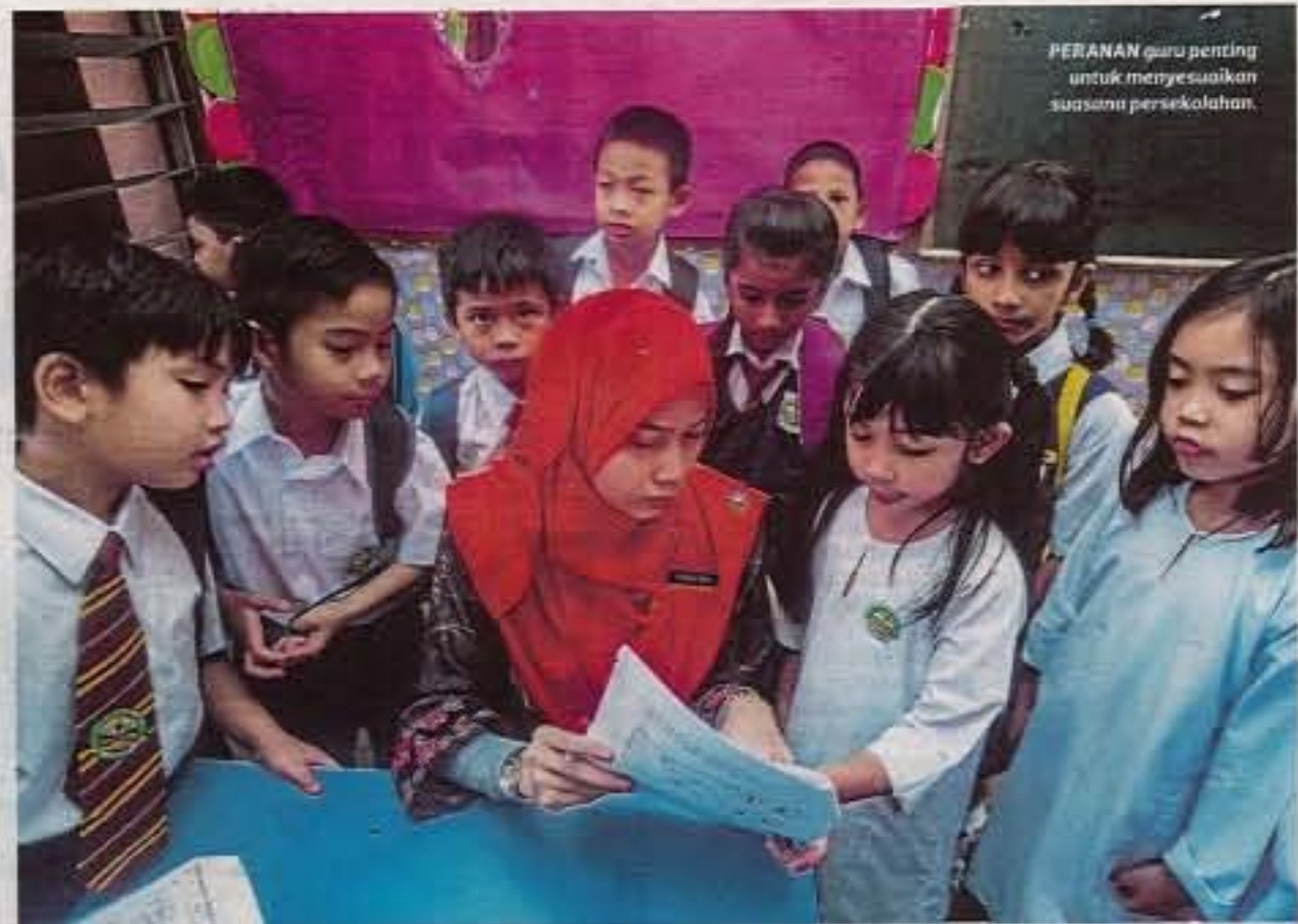
PERANAN guru penting untuk menyesuaikan suasana persekolahan.

"Malam sebelum sesi persekolahan bermula juga duduk bersama anak dalam