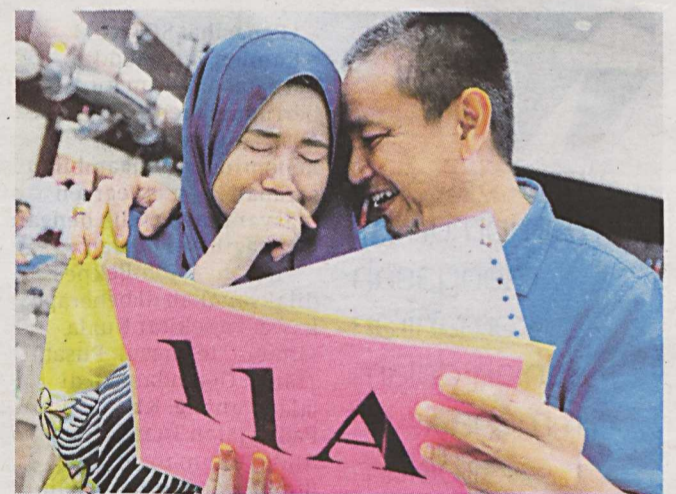
IBU bapa antara yang paling gembira dengan kejayaan anak mereka.