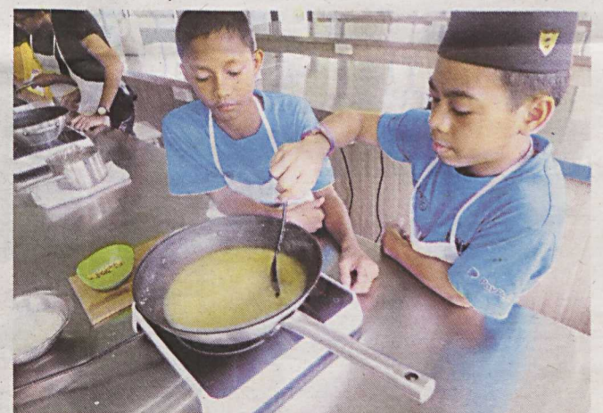
BERI peluang kepada anak anda untuk meneroka, jangan didesak dengan aktiviti belajar semata-mata.