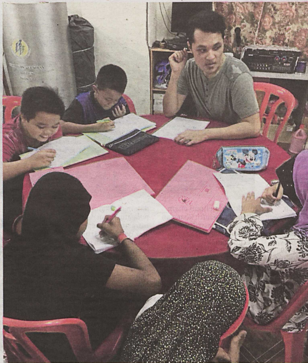
SEAWAL usia 10 tahun waktu sesuai untuk ibu bapa hantar anak mereka ke pusat tuisyen.

Namun jika kanak-kanak seawal usia ini dihantar ke pusat membaca, sudah tentu ia tidak menjadi isu kerana latihan membaca