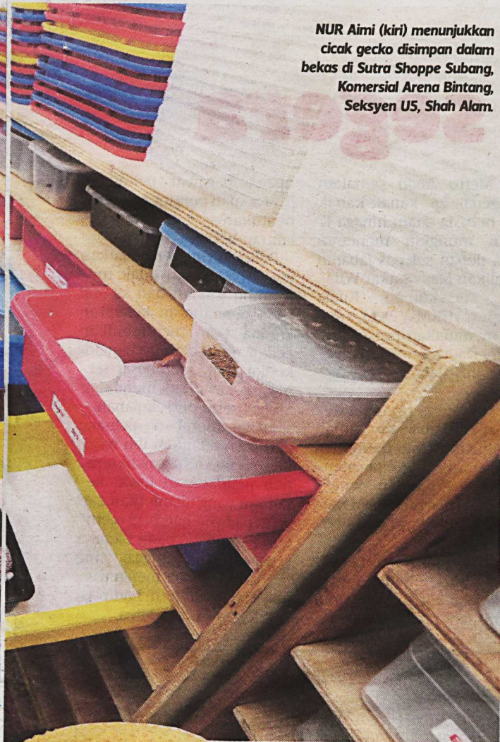
NUR Aimi (kiri) menunjukkan cicak gecko disimpan dalam bekas di Sutra Shoppe Subang, Komersial Arena Bintang, Seksyen US, Shah Alam.