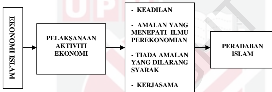
Rajah 1.1 : Model Teori Ekonomi Ibn Khaldun

penting dalam memenuhi tanggungjawab manusia sebagai khalifah Allah s.w.t. di atas muka bumi ini. Ilmu perekonomian dan lain-lain kemahiran berkaitan urusan harian akan memberikan kelebihan kepada manusia berbanding makhluk lain. Asas ketiga yang dibincangkan dalam teori ekonomi Ibn Khaldun ialah tiada amalan yang dilarang oleh syarak khususnya dalam melaksanakan aktiviti ekonomi atau muamalat. Manusia wajib mematuhi ajaran Islam dengan menjauhi segala kejahatan dan memberi keutamaan kepada perkara-perkara yang berkaitan akhirat. Asas keempat dalam teori ekonomi Ibn Khaldun ialah kerjasama. Sikap kerjasama sangat penting dalam hubungan dan pelaksanaan aktiviti perekonomian seperti dalam jual beli atau perniagaan. Menurut Ibn Khaldun, kemampuan seseorang individu tidak memadai kepadanya untuk mendapatkan makanan yang diperlukannya, namun melalui kerjasama, keperluan beberapa orang, beberapa kali ganda lebih besar daripada keperluan diri mereka dapat dipenuhi. Akhirnya teori ekonomi Ibn Khaldun dapat di gambarkan seperti rajah 1.1: