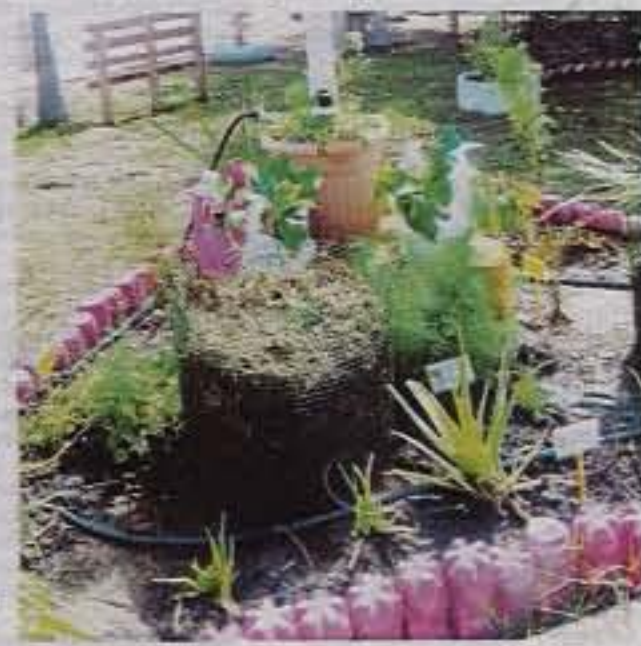
TAMAN Herba Pusat Transformasi Komuniti Universiti di Sekolah Kebangsaan Seri Sekinchan, Selangor.

Pemajuan Profesional (APEFC), iaitu entiti bawah UPM. Ia bertanggungjawab memantapkan perkhidmatan perundingan dalam pelbagai bidang kepakaran seperti pembangunan komuniti, pengembangan pertanian, pembangunan keusahawanan serta pemajuan profesional. Penubuhan UCTC adalah untuk menjadi penghubung selain mengurangkan jurang antara universiti awam dan komuniti setempat.