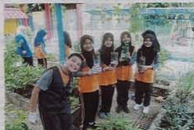
LAMAN Herba SK Bukit Lintang, Kota Tinggi.

"Terbaru, kami menjalankan projek komuniti Taman Herba dengan kerjasama Sekolah Kebangsaan Sri Sekinchan, Selangor bagi mendidik warga sekolah mengenai tumbuhan sayuran dan kepentingannya kepada masyarakat," katanya. Sementara itu, UCTC sebelum ini dikenali sebagai Pusat Pengembangan dan Keusahawanan dan