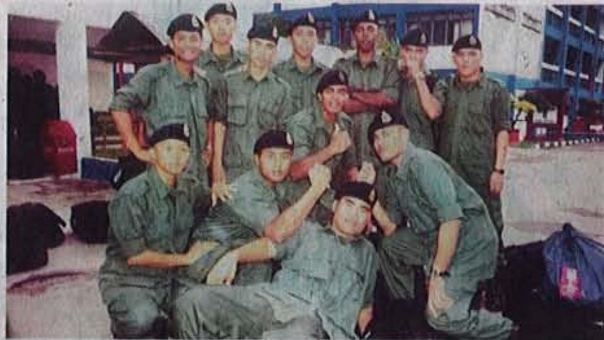
GAMBAR kenangan bersama rakan sepasukan sewaktu menjalani latihan di Pulapol Kuala Lumpur pada 2002.

Menurut beliau, apa yang lebih menyayat hati apabila mayat kanak-kanak itu ditemui dalam sebuah beg pakaian