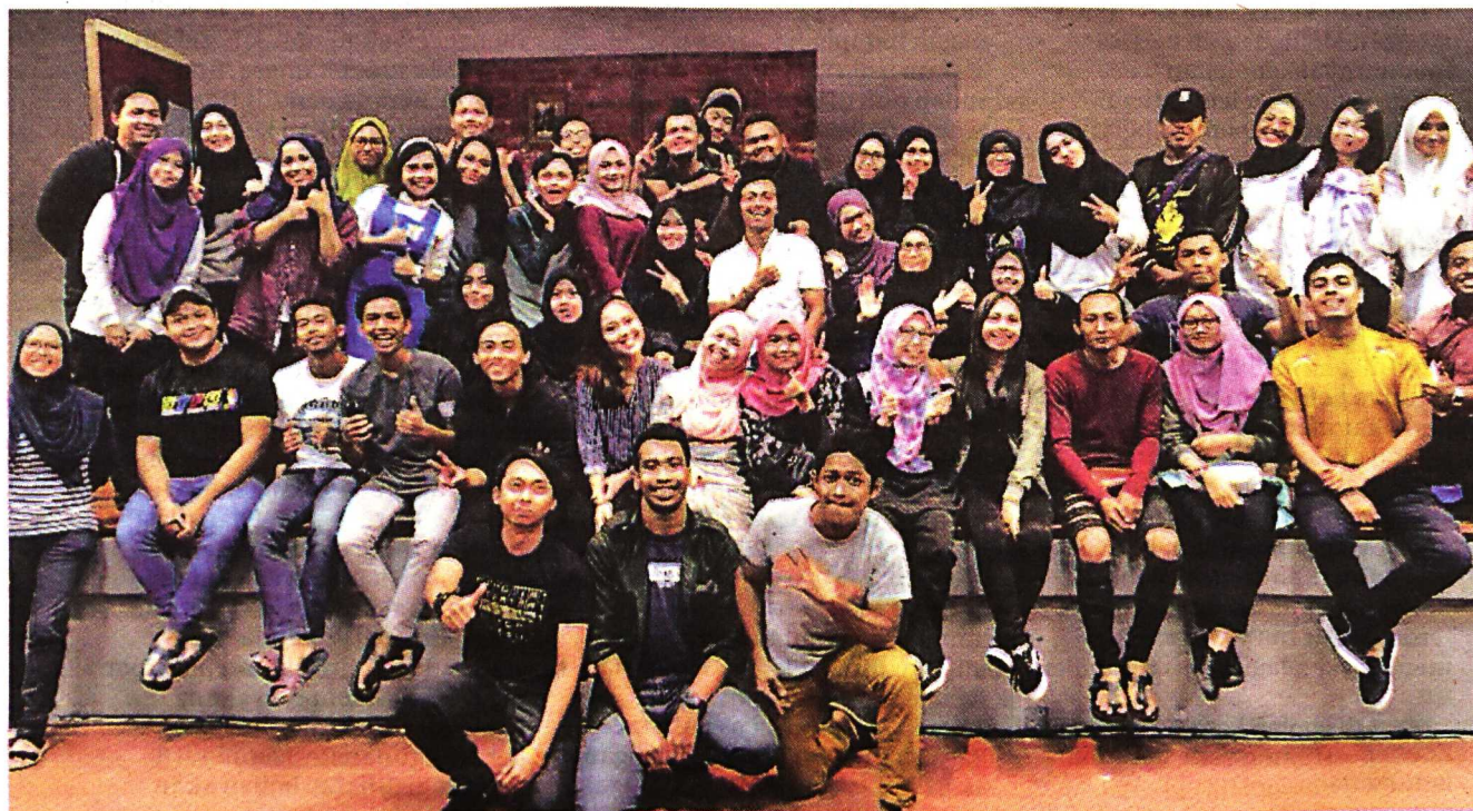
AHLI kelab PENTAS bergambar kenangan selepas teater.

Hampir 200 penuntut baharu UPM yang mendaftar dan membuktikan seni teater masih mendapat tempat di hati kebanyakan belia masa kini.