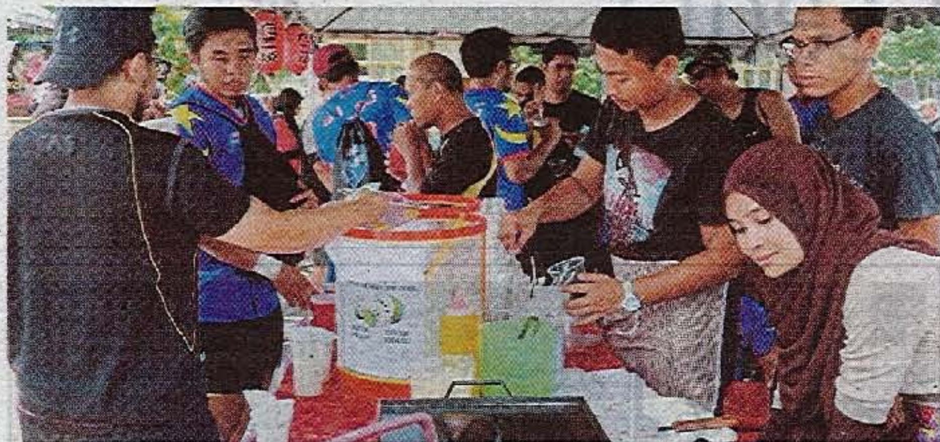
Penganjuran program mendapat sambutan memberangsangkan daripada pengunjung.

Oleh Meor Ahmad Nasriin Rizal Ishak meor.ahmad@bh.com.my