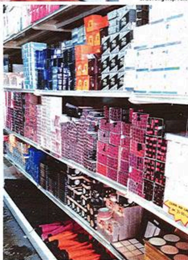
LAMBAKAN produk jenama Korea tiruan dijual secara terbuka di Lorong Haji Taib.

Selain logam berat, pengguna juga perlu menerima hakikat bahawa kemungkinan wujudnya tretinoin, hidrokuinon dan