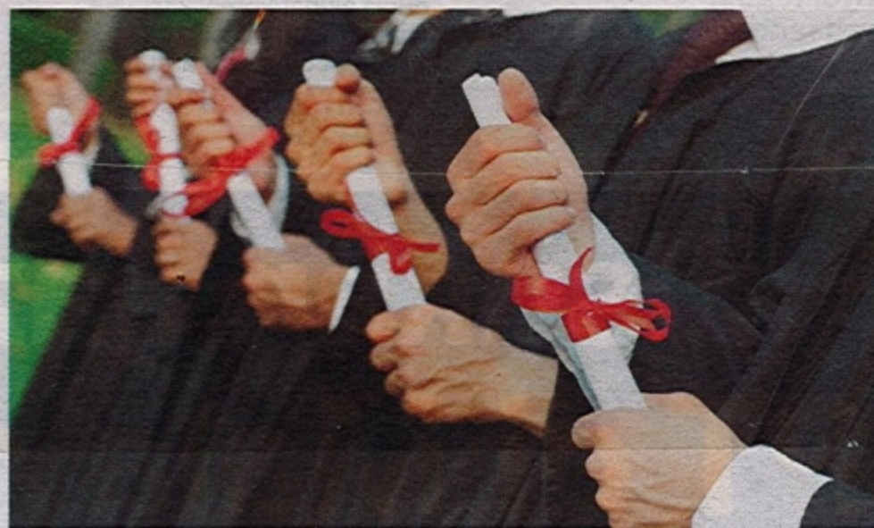
INDIVIDU yang membeli ijazah palsu boleh memperoleh sijil mereka hanya dalam tempoh satu hari, sedangkan mahasiswa di IPT terpaksa menghabiskan masa antara tiga hingga empat tahun di kampus.

turut menghantui institusi pendidikan di luar negara, ia telah berlaku sejak 20 atau 30 tahun lalu hingga menyebabkan kekeliruan dalam masyarakat untuk membezakan ketulenannya.