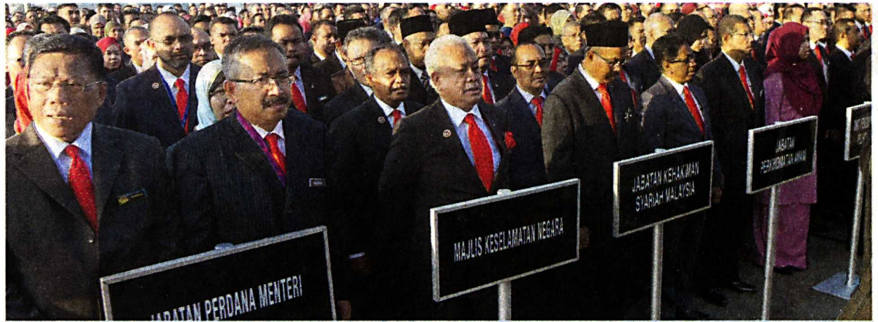
PERANCANGAN hebat dalam Bajet 2018 tidak akan memberi impak kepada rakyat andai penjawat awam tidak mampu melaksanakan amanah mereka dengan berkesan. - GAMBAR HIASAN/BERNAMA

Malah cuti rehat Pegawai Perkhidmatan Pendidikan juga dinaikkan daripada tujuh hari kepada 10 hari di samping kemudahan tujuh hari cuti tanpa rekod bagi menunaikan umrah serta penambahan satu lagi waktu kerja berperingkat iaitu bermula jam 9 pagi