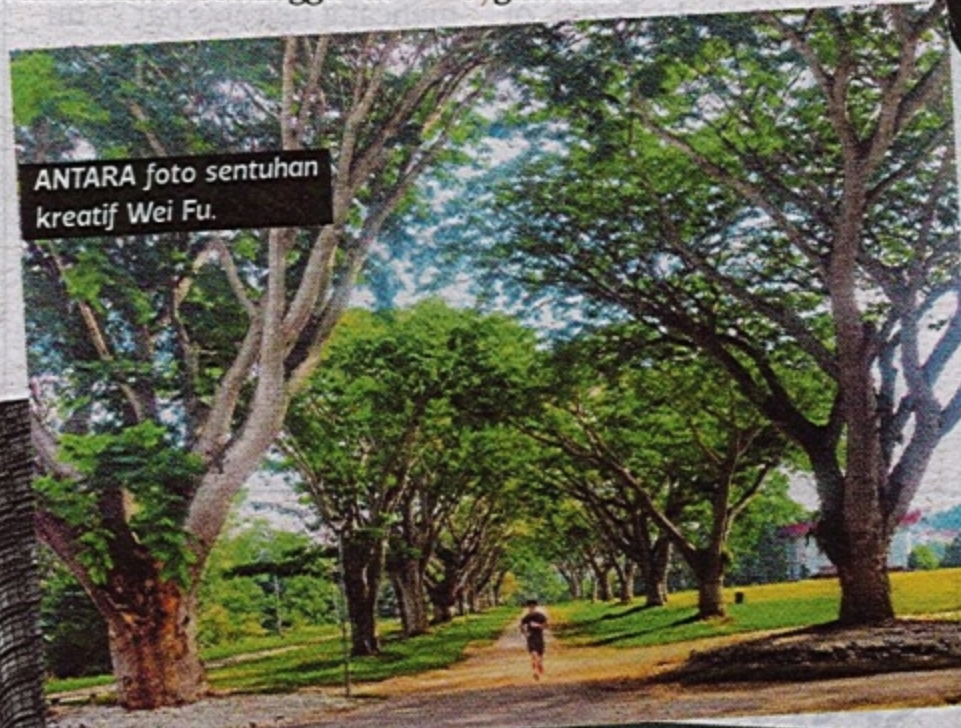
ANTARA foto sentuhan kreatif Wei Fu.

pun berkata, dia tidaklah terlalu serius untuk menjadi seorang jurugambar profesional.