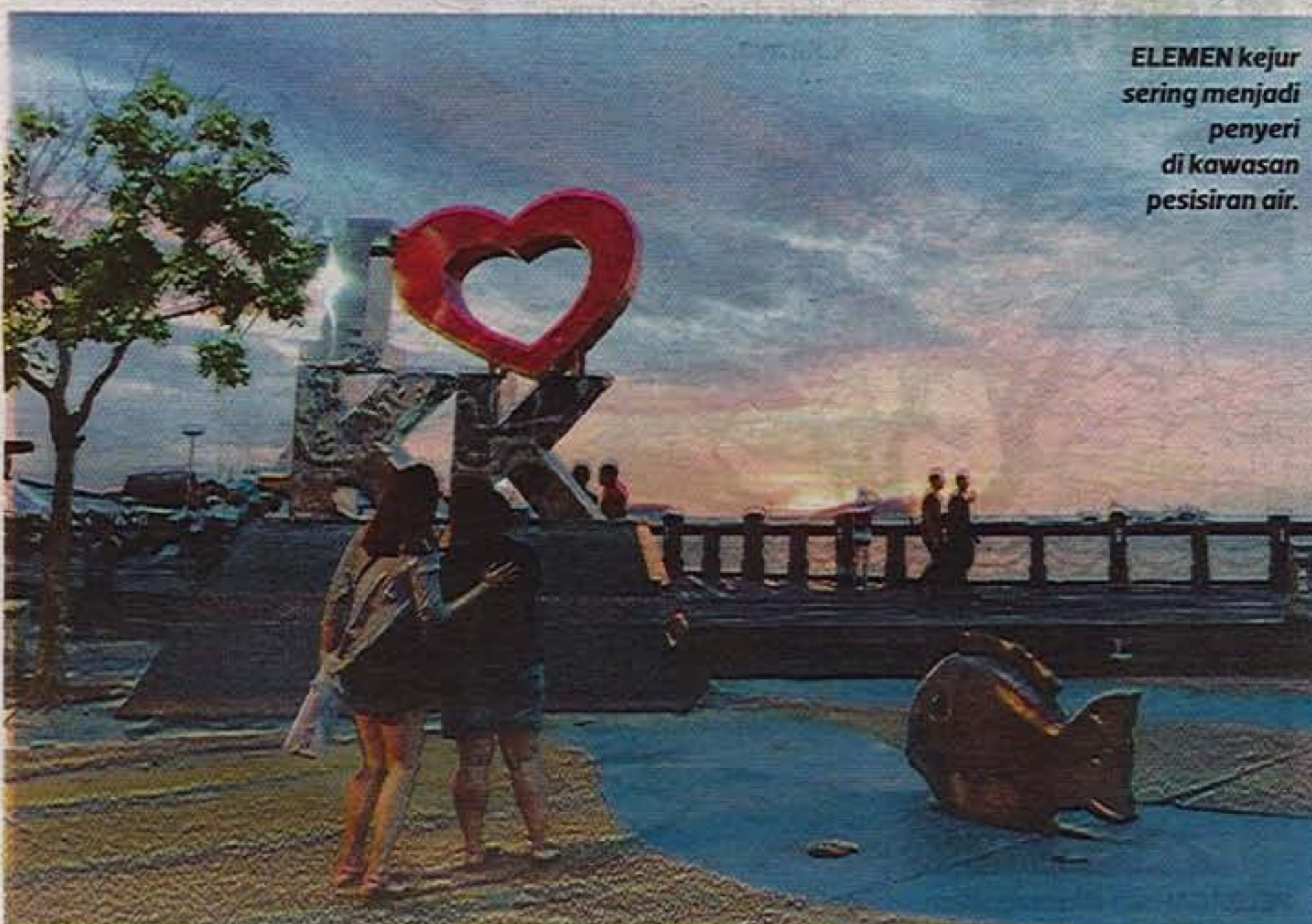
ELEMEN kejur sering menjadi penyeri di kawasan pesisiran air.