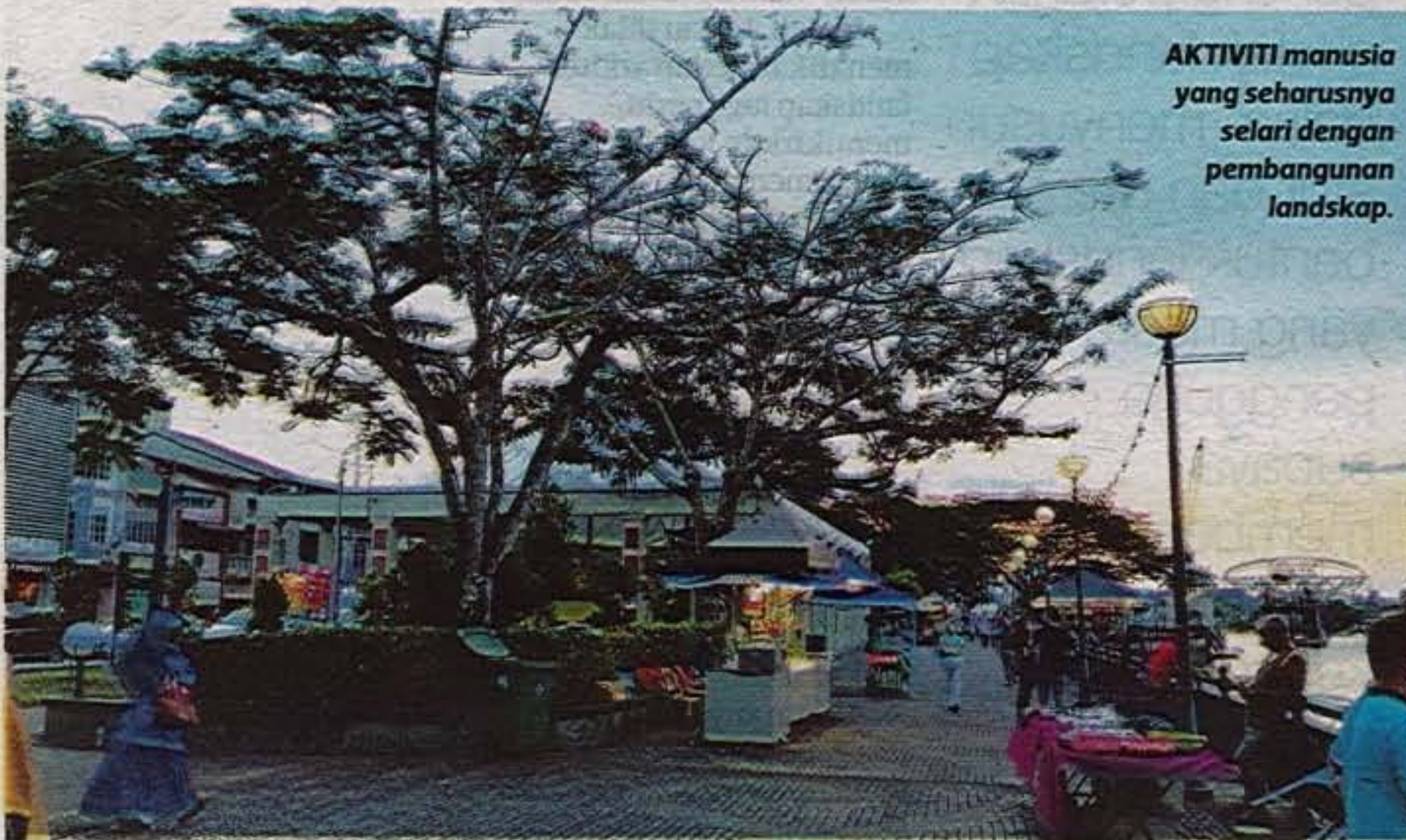
AKTIVITI manusia yang seharusnya selari dengan pembangunan landskap.